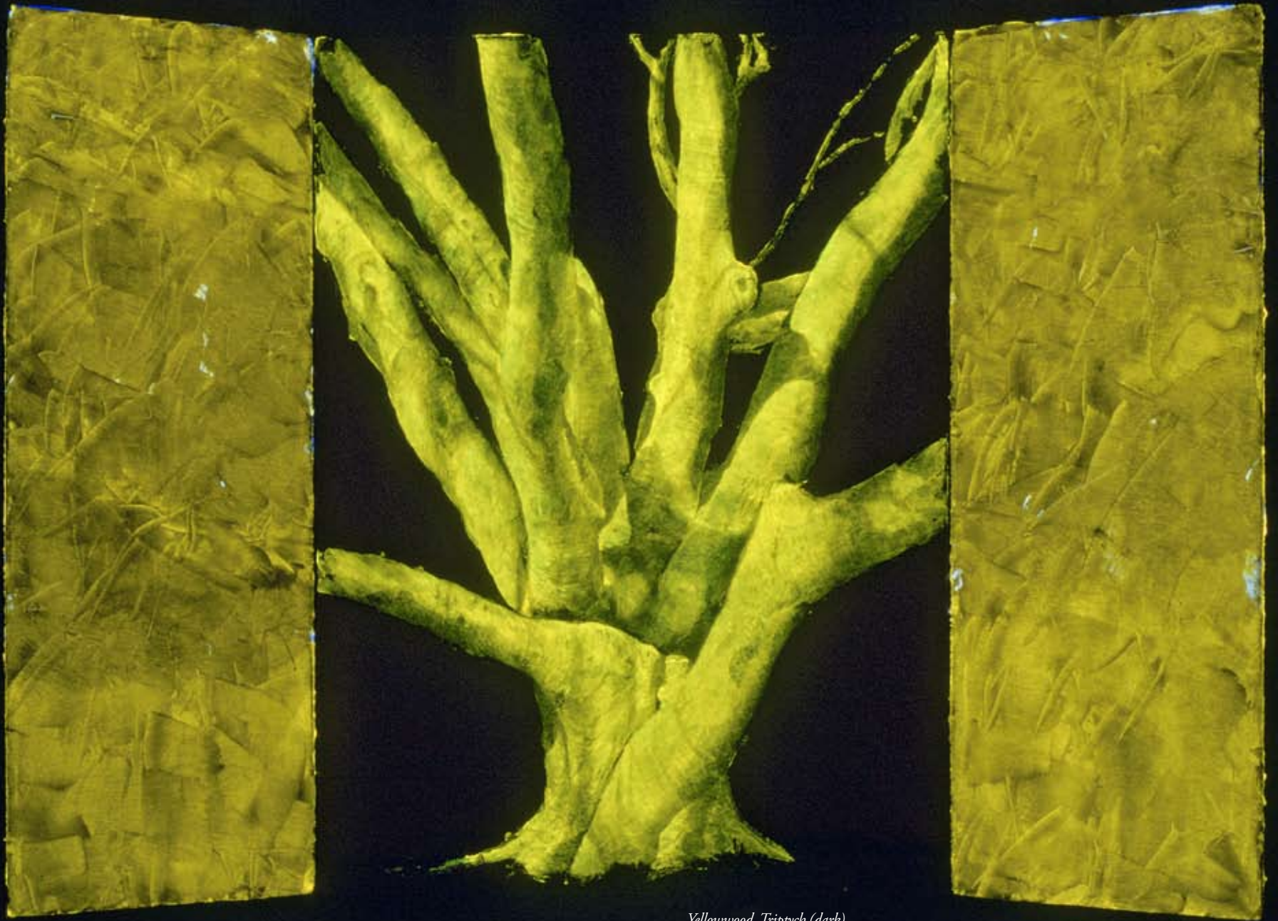
Yellowwood, Triptych (dark)