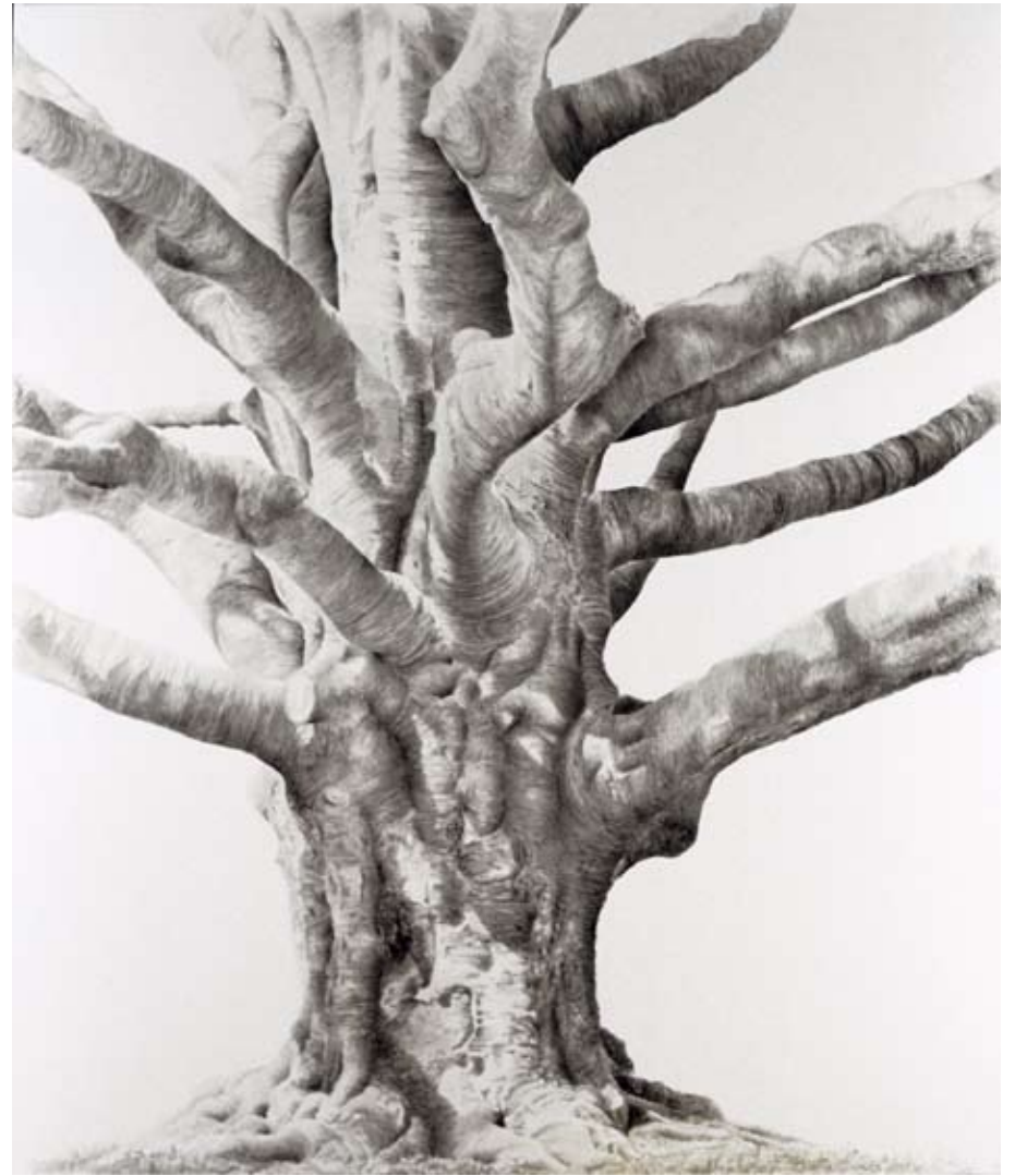
Great Copper Beech. Oil on canvas, 216x185 cm.