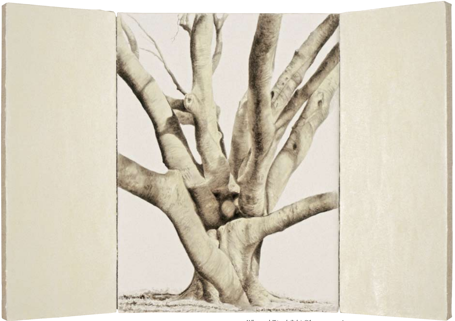
Yellowwood, Triptych (light) . Oil on canvas, 216X122 cm.