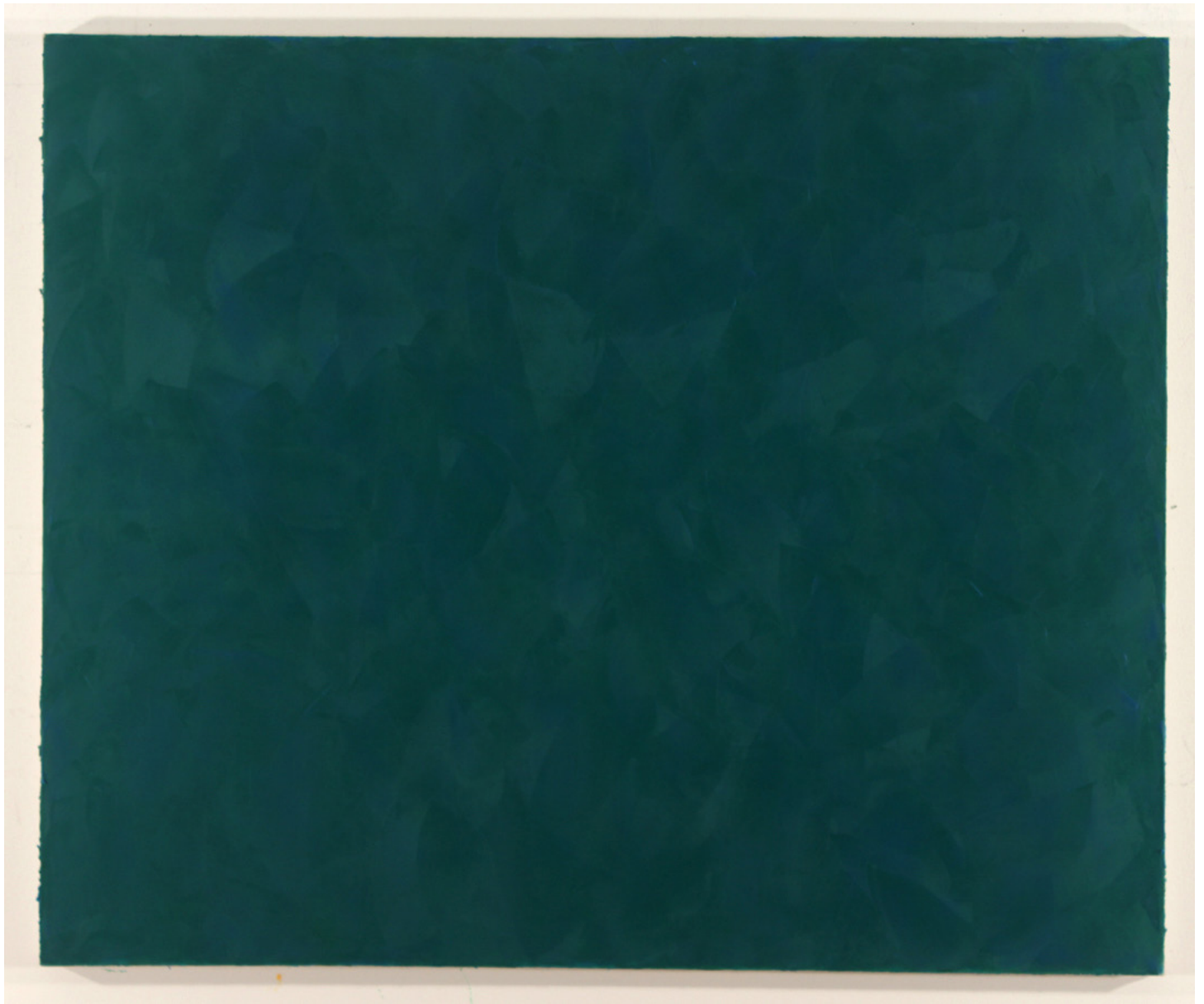
Victor's green, 86 x 104 cm, 2014