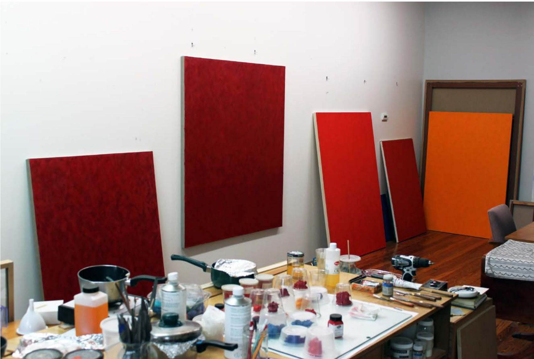
Från ateljén i Brooklyn