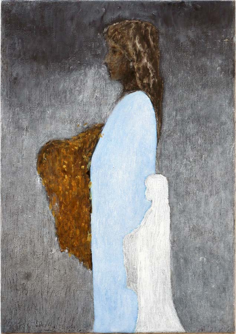
Cecilia Edefalk - Utan titel